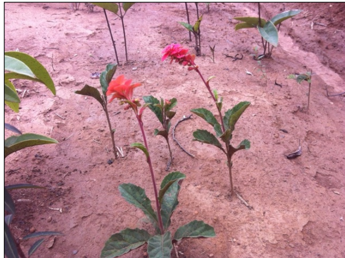
Figura 2. Imagem do hábito de Amasonia spruceana coletada em São Domingos do Azeitão, Estado do Maranhão. / Figure 2. Image of the habit of Amasonia spruceana collected in São Domingos do Azeitão, State of Maranhão.

Com base no banco de dados do mapa de solos do IBGE (2001), todos os registros listados de A. spruceana no país estão em solos do tipo latossolo amarelo e neossolo litólico, exceto o registro do Ceará, que é descrito como argilossolo vermelho-amarelo. Essa informação corrobora Santos et al. (2012), que apontam essa espécie ocorrendo principalmente sobre latossolos. Com relação a ocorrência da espécie em relevos de grande altitude, apenas o registro de Serra do Curral Feio (Sento Sé, Bahia, 950- 1000m) e o presente registro na Chapada da Bacaba (São Domingos do Azeitão, Maranhão, 407-412m) informam a altitude. Segundo dados de ocorrência para a Colômbia e Venezuela, a espécie também ocorre em altitudes entre 200 e 800m (SANTOS et al., 2012).