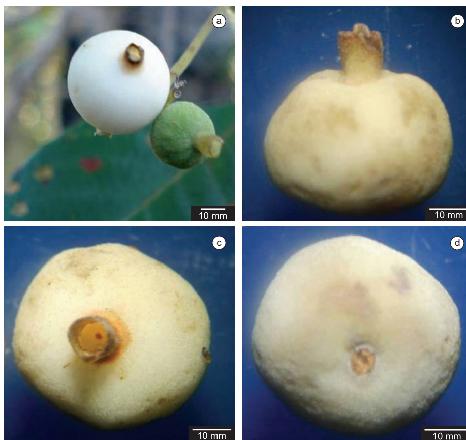
Figura 1. Aspecto morfológico do fruto de Guettarda platypoda DC.: a) Fruto maduro e imaturo; b) Vista longitudinal do fruto; c) Região apical do fruto; e d) Região basal do fruto.